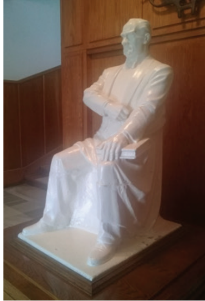
Görsel 16. Anıttaki Atatürk figürünün alçı modeli.

Atatürk figürünün ön çalışması olduğu anlaşılan üzerinde imzaya rastlanamasa da (üst üste gerçekleştirilen beyaz yağlı boya katmanlarıyla örtülmüş olabilir) Ratip Aşir Acudoğu'nun elinden çıktığı, taşıdığı plastik anlayış nedeniyle kesin olan ve aşağıda görseli görülen 1,3m.'lik alçı model halen dekanlık girişinde bulunmaktadır (Görsel 16). Bu modelin heykelin son hali düşünülerek belli bir oranda yapıldığı anlaşılmaktadır. Figürün gerçek yüksekliğinin yaklaşık 3,30m. olduğu dikkate alındığında bunun modelin ölçüsünün yaklaşık olarak 2,5 katı olduğu ortaya çıkmaktadır. Ölçeğe dair bir diğer önemli veri de gerçek figürdeki taş blokların kesişme çizgilerinin alçı modelde de gösterilmiş olmasıdır.