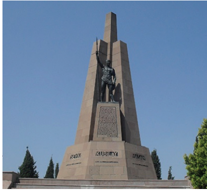
Görsel 3 Ratip Aşir Acudoğu, Menemen Kubilay Anıtı, Taş ve Bronz, Toplam Yükseklik; 15.66m, Bronz Figür Yüksekliği; 3.98m, 1934.

Anıtın taş kısmı, bir ana kaide üzerinde diğer bir küçük kaide ile birbirine yaslanmış ve birbirini tutan üç adet, dört köşeli dikilitaş biçiminde sütundan yapılmıştır. Sütunlardan ortadaki daha uzun ve iri diğer ikisi ise bu ana sütunun iki yanında simetrik ve daha kısa olarak yer almaktadırlar. Bu üç sütun hem tek tek hem de birlikte daralan bir açıyla yükselmektedirler. Ana kaide, üç sütun onların adeta kucakladığı ve anıtın ön yüzünde yer alan ikinci kaide, tıpkı üzerinde yer aldıkları merdivenli platform gibi kesme taştandır. Bahsi geçen ikinci kaide üzerinde ise sağ elinde kargı tutan bir Türk gencinin bronz figürü bulunmaktadır.