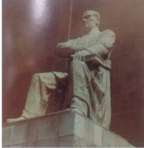
Görsel 13. A.Ü. Ziraat Fakültesi Atatürk Anıtı, Kaide Kaplama Detayı

Gerek basamak sayısının artırılmasının gerekse de kaide kaplamasının sanatçının bilgisi dahilinde ve kendi isteğiyle yapıldığı muğlak bir konudur. Bu kaplama muhtemelen, Görsel 8 ve aşağıda yer alan Görsel 13'de görülen kaplamadır.