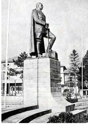
Görsel 4. Ratip Aşir Acudoğu, Bolu Atatürk Anıtı, Taş ve Bronz, Toplam Yükseklik; 7m, Bronz Figür Yüksekliği; 3m, 1940.

Açılışı 1940 yılında yapılan anıtın figür kısmı bronz, kaide kısmı da kesme taş kaplamadır. Figürün yüksekliği yaklaşık 3m. ve kaidenin yüksekliği de yaklaşık 4m. olmak üzere anıtın toplam yüksekliği yaklaşık 7m'dir. Atatürk mareşal giysisi ve sırtında pelerini ile başı açık şapkasız olarak tasvir edilmiştir. Sol ayağı bir yükselti üzerinde, dizden kırık ve diğerinden bir adım öndedir. Sol eli yana sarkmış biçimde bir kitap ve sağ eli de bedeninin tam ortasında yere dayalı duran kılıcı tutmaktadır (Osma, 2003, s.116,117).