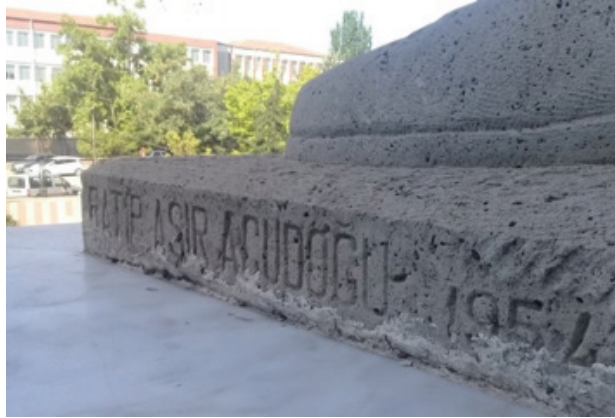
Görsel 9. A.Ü. Ziraat Fakültesi Atatürk Anıtı, İsim ve Tarih Detayı.

Anıt hakkında daha fazla detaylı bilgiye ulaşabilmek amacıyla Ankara Üniversitesi Ziraat Fakültesi ile kurulan telefon iletişiminin sonucu ulaşılan, 'Ankara Üniversitesi Ziraat Fakültesi Müzesi' kurucusu Sanat Tarihçi Servet Sarıaslan'dan elde edilen ilk sözel ve görsel bilgilerin ardından, anıt bu satırların yazarınca 21 Haziran 2018 tarihinde bulunduğu mekanda ziyaret edilmiştir.* Ziyaret esnasında sanatçının adının ve bu çalışma için yararlanılan kaynaklarda rastlanılamayan yapım tarihinin, Atatürk figürünün sol ayağının bastığı heykel tabanının yan yüzeyine, 'RATİP AŞİR ACUDOĞU 1954' olarak net bir biçimde yontularak yazıldığı açıkça görülmüştür (Görsel 9).