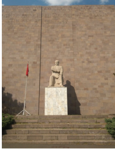
Görsel 14. A. Ü. Ziraat Fakültesi Atatürk Anıtı, kaidenin son hali.

Arka fon, basamaklı platform, figür ve figürün üzerinde durduğu kaide ve bu kompleks yapının ön cephesinde doğal olarak oluşan tören alanının birbirleriyle kurduğu proporsiyonel ilişkiler irdelendiğinde, anıtın büyük bir ustalıklarla tasarlandığı sonucuna varılmaktadır.