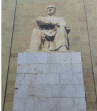
Görsel 8. Ankara Üniversitesi Ziraat Fakültesi Atatürk Anıtı, Figür ve Kaide Detayı.

Ankara Üniversitesi Ziraat Fakültesi'nde yer alan Atatürk Anıtı Acudoğu'nun en son gerçekleştirdiği ama buna rağmen literatürde en az bilgiye rastlanılan anıttır. Bara (1957, s.43) makalesinde tarih belirtmeksizin sadece anıtın Acudoğu tarafından yapıldığını yazmaktadır. Gezer de (1984, s.97) yine tarih vermeksizin sadece anıtın Acudoğu'ya ait olduğunu söylemekte ve kitabındaki heykel fotoğrafları kısmında anıtın bir görseline de yer vererek (Görsel 8), anıtın taştan yapıldığı bilgisini aktarmaktadır. Aynı şekilde, yine detay verilmeksizin sadece anıtın Acudoğu'ya ait olduğuna dair bilgilere Osma'nın (2003) ve Özsezgin'in (1999) kitaplarında da rastlanmaktadır.