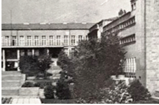
Görsel 12. Anıt ve binanın 1970'lerin başındaki görünüşü

Gerek basamak sayısının artırılmasının gerekse de kaide kaplamasının sanatçının bilgisi dahilinde ve kendi isteğiyle yapıldığı muğlak bir konudur. Bu kaplama muhtemelen, Görsel 8 ve aşağıda yer alan Görsel 13'de görülen kaplamadır.