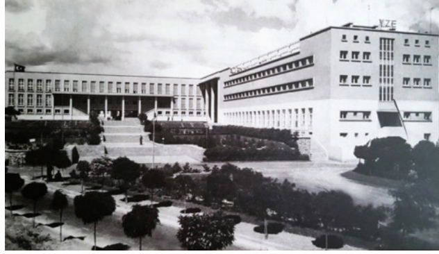
Görsel 10. Binanın anıt yapılmadan önceki görünüşü.

Anıtın gerçekleştirilebilmesi ve en önemli ögesi olan Atatürk figürüne uygun bir fon sağlanabilmesi için, belli bir açıklıkla binanın batı cephesinin tümüyle yeni bir duvarla kapatıldığı ve andezit ile kaplandığı görülmektedir. Bu duvarın üst sınırına yakın bir bölgede iki satır halinde, yontu tekniğiyle yazılmış, “TÜRK GENÇİ REJİMİN VE İNKILAPLARIN SAHİBİ VE BEKÇİSİDİR” cümlesi yer almakta ve altında Atatürk’ün imza stilinde K.Atatürk yazmaktadır. Heykel kaidesinin bastığı tabanın da üç basamaklı bir platform şeklinde tasarlandığı ve arka fon ile uyum ve birliktelik duygusunun yakalanması için andezit kaplama anlayışının bu birimlerde de sürdürüldüğü anlaşılmaktadır (Görsel 11).