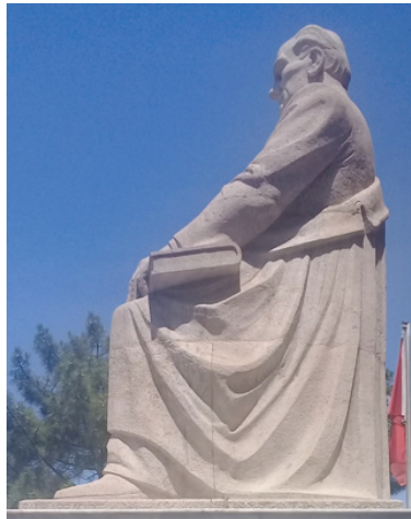
Görsel 15. A. Ü. Ziraat Fakültesi Atatürk Anıtı, taş bloklarının ilişkisi ve rengine ait detay.

Atatürk figürünün yüksekliği yaklaşık 3,30m. ve onun üzerinde durduğu kaidenin yüksekliği ise 3m'dir. Figür dört adet traverten bloğun yan yana ve üst üste ustaca koyularak birbirine monte edilmesi ile elde edilmiş büyük boyutlu bir traverten kütesinin yontulmasıyla ortaya çıkarılmıştır. Bu bloklardan ilk ikisi; taban ve alt bacakların olduğu bölümde yan yana birbirlerine bağlanmışlardır. Üçüncüsü; bu ikisinin üzerine basmakta ve diz kapaklarının altından başlayıp sağ elinin alt sınırı ile sol kol dirseği hizasında bitmektedir. Dördüncü ve sonuncusu da; sağ elinin alt sınırı ile sol kolu dirseği hizasından başlayıp yukarıda başın tepe noktasında sona ermektedir. Travertenler beyaz olarak adlandırılan en açık tonlu traverten cinsindedir (Görsel 15).