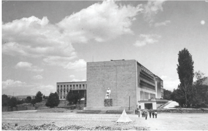
Görsel 11. Binanın, anıtın ilk aşamalarının tamamlandığı anlardaki görünüşü.

Anıtın gerçekleştirilebilmesi ve en önemli ögesi olan Atatürk figürüne uygun bir fon sağlanabilmesi için, belli bir açıklıkla binanın batı cephesinin tümüyle yeni bir duvarla kapatıldığı ve andezit ile kaplandığı görülmektedir. Bu duvarın üst sınırına yakın bir bölgede iki satır halinde, yontu tekniğiyle yazılmış, “TÜRK GENÇİ REJİMİN VE İNKILAPLARIN SAHİBİ VE BEKÇİSİDİR” cümlesi yer almakta ve altında Atatürk’ün imza stilinde K.Atatürk yazmaktadır. Heykel kaidesinin bastığı tabanın da üç basamaklı bir platform şeklinde tasarlandığı ve arka fon ile uyum ve birliktelik duygusunun yakalanması için andezit kaplama anlayışının bu birimlerde de sürdürüldüğü anlaşılmaktadır (Görsel 11).