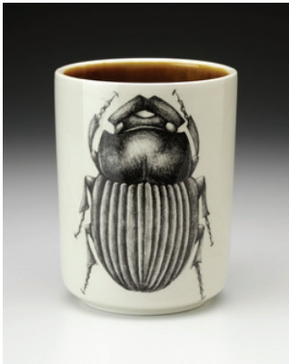
Görsel 34. "Scarab Beetle" 5.25" x 5.25" x 7", 1998

Amerikalı sanatçı Laura Zindel, eserlerinde böcek imgesine yer veren diğer sanatçılardan biridir. Sanatçının doğaya ve tasarıma gösterdiği ilgi, geçen yüzyılın başında ortaya çıkan Arts & Crafts hareketi tarafından savunulan, materyallerin biçim ve gerçeğin sadeliği ilkesine dayanmaktadır. Sanatçının imge kullanımı ve desenleriyle oluşturduğu yaklaşımının temelinde bu yöntemleri övme ve dekoratif sanat dünyasıyla alakalı olarak koruma amacı bulunmaktadır. Arts & Crafts hareketinin pragmatizmasının aksine Zindel, 17. yüzyılda Avrupa' da başlayan sanat hazineleri ve doğal dünyanın harikaları ile dolu olan Viktorya Dönemi vitrinlerine (Cabinets of Curiosities) ilgi göstermiştir. Saplantılı bir bağlılık ile dolaplara yerleştirilen bu nesnelerin eklektik zenginliği, Zindel' in sanatına verdiği yanıtta açıklanamayan ilkel bir şeye dokunmaktadır. Sanatçının tutkusu, elle ve endüstriyel üretim yöntemleri ile gerçekleştirilen ürünlerin kendine özgü etkisini birleştirmektedir. Ortaya çıkan ürünler doğal yaşamın güzelliklerini, merakını ve çeşitliliğini yansıtmaktadır (Görsel 34-35-36-37) ( http 9 ).