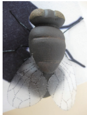
Görsel 11. “Gölge” Detay, 15x15x5 cm, 2011