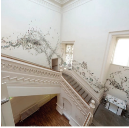
Görsel 32. "Stirring the Swarm" Enstalasyonundan Görünüm, Birimler: 2-20 cm aralığındadır. Nottingham Kalesi, 2012