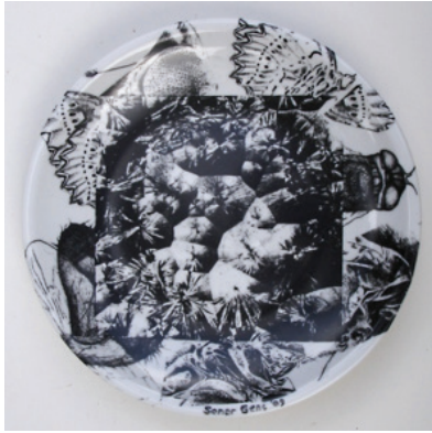
Görsel 20. "İsimsiz" R:28 cm, 2009

Soner Genç, eserlerinde böcek imgesini kullanan Türk sanatçılardan biridir. Böcek imgesini kullandığı çalışmalarını transfer yöntemi ile gerçekleştiren Genç, farklı böcek türlerini, kara-kalem desen oluşturduktan sonra sır üstü çıkartmalarını kendisi hazırlamaktadır. Siyah-beyaz tonlardaki çalışmalarında doğadan aldığı farklı böcek türleri görülmektedir. Tabakların iç yüzünde belli bir düzende (sıralı, üst-üste) oluşturduğu kompozisyonlarda böcek imgeleri çarpıcı şekilde ön plana çıkmaktadır (Görsel 20-21-22-23).