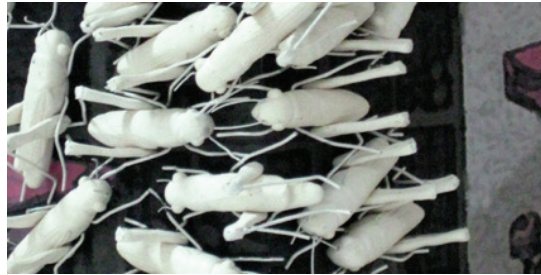
Görsel 9. “İstila” Detay, 135x60x50 cm, 2009