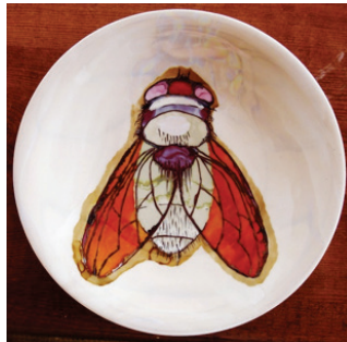
Görsel 18. "Sinek" R:28 cm, 2010

Pınar Genç, eserlerinde böcek imgesini kullanan Türk sanatçılar arasındadır. Bazı böceklerin sahip olduğu çarpıcı renkler ve anatomik özellikleri sanatçının dikkatini çekmiştir. Tabak formu üzerinde çalıştığı böceklerin canlı renklerini lüster tekniği ile ortaya koyan Pınar Genç' in gerçekçi çalışmalarının yanı sıra fantastik bir yaklaşımla ortaya koyduğu eserleri de mevcuttur (Görsel 18-19).