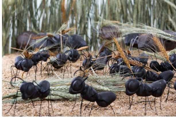
Görsel 4. “Tohum Takas” Projesi, 1,5 m2, 2014

Buket Acartürk uzun süredir farklı misyonlar yükleyerek karınca figürleri yapmaktadır. Türk sanatçı, kişisel kaygı ve düşüncelerini, toplumsal alanda söylemek istediklerini sanatsal alanda biçime dönüştürmektedir. Karıncaları özellikle örgütlü yaşam biçimleri ve disiplinleri nedeniyle seçmiş olan sanatçı, “Tohum-Takas” isimli projesinde buğday başağı taşıyan karıncaları ile yeryüzünün yoksulluk ve beraberinde en temel sorunu olan açlık durumuna dikkat çekmek istemiştir (Görsel 4).