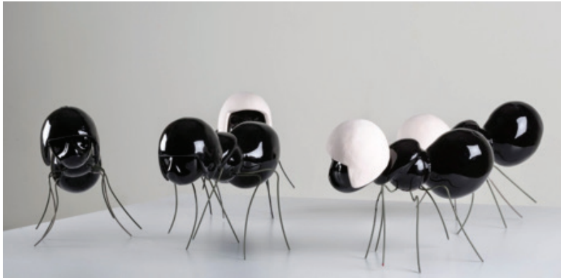
Görsel 5. “Çarşı” 80 cm2, 2014

Yaşanan toplumsal değişim ve dönüşümlerin etkisi ile yeniden yorumladığı karıncalarını izleyicilerle buluşturan sanatçı, “Sınana Sınana” isimli sergisinde meydan kavramını temsil ederken gaz maskeli karınca figürleri ile baskıya direnmenin serüvenini simgelemektedir (Görsel 5-6-7). Aidiyet duygusunu güçlendiren, meydanlara, haksızlıklara, baskılara ve insanların bir amaç uğruna “bir-aradalığına” karınca figürleri ile göndermede bulunan seramik sanatçısı Buket Acartürk, insanlık serüveninin tarihsel, toplumsal ve siyasal deneyimlerini kendi bilimsel ve sanatsal süzgecinden geçirerek “Sınana Sınana” adlı sergisinin her parçasında yansıtmaya çalışmıştır (http 6).