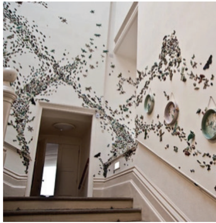
Görsel 31. "Stirring the Swarm" Enstalasyonundan Görünüm, Birimler: 2-20 cm aralığındadır. Nottingham Kalesi, 2012

Sanatçı, gittiği yerlerde karşılaştığı nesnelere etkilenerek eserler üretmektedir. Bu nesne mermer bir büst, mobilya veya hayvan postu olabilmektedir. Yakalamak istediği etkiyi arttırmak için ölçülerle oynamaktadır. Görsel derinlik ise seramik yüzey üzerinde renk, işaretler, transferler ve lüster uygulamalarıyla sağlanmaktadır. Nihai nesnelere ise sevindirici, merak uyandırıcı ve izleyicisini ömür boyu büyüleyecek zengin bir varlık sergilemektedir. Stüdyo koleksiyonlarının yanı sıra 2012 yılında Nottingham Kalesi'nde geniş ölçekli bir enstalasyon da gerçekleştirmiştir. Nottingham Entomoloji (Böcekbilim) koleksiyonunu inceledikten sonra kendi masalını yazmaya karar veren Hunt, zihninde canlandırdığı hikâyesini çamur üzerinde canlandırmaya başlamıştır. Bir yılın içerisinde Nottingham Kalesi'ni adeta istila eden 10.000 adet seramik böcekten oluşan güzel ve unutulmaz bir sürü yapmıştır. İzleyici, hikâyenin ve enstalasyonun gaddar güzelliğinin tadını çıkarmaya çalışarak masalının içine girmeyi başarmıştır. İlgili yapıt ulusal ve uluslararası izleyicisi tarafından halen büyük bir heyecan ve merakla ziyaret edilmeye devam etmektedir (Görsel 31-32-33) ( http 8 ).