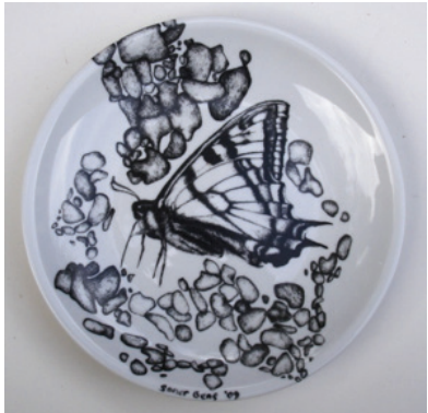
Görsel 22. "İsimsiz" R:28 cm, 2009