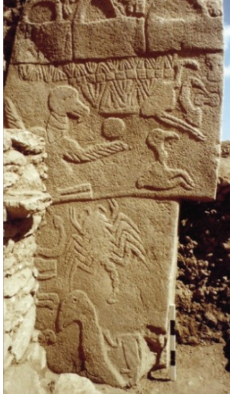
Görsel 3. Göbeklitepe Tapınağı'nda yer alan stel üzerindeki akrep kabartması, M.Ö. 10.000, Şanlıurfa, Göbeklitepe

Sanat eserleri imgeleri temsil etmektedir. Duyu yoluyla alımlanan imgelerin her bireyde oluşturduğu etki farklıdır. Buna bağlı olarak ortaya çıkan yansımaları da farklıdır. (Bayav, D. 2009) Böcek imgesinin uygarlık tarihindeki yeri yukarıda da söz edildiği gibi oldukça geniştir. Çağdaş sanat açısından bakıldığında böcek figürü ve imgesi resim, heykel, mimari, tekstil, seramik ve benzeri disiplinlerde karşımıza çıkmaktadır.