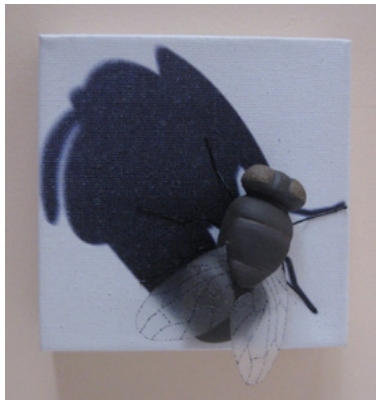
Görsel 10. “Gölge” 15x15x5 cm, 2011