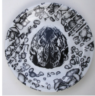
Görsel 21. "İsimsiz" R:28 cm, 2009