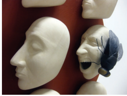
Görsel 13. "Musibet" Detay, 50x50x10 cm, 2016

Bir diğer Türk Sanatçı Perihan Şan Aslan doğanın önemli bir parçası olduğunu düşündüğü böcekler üzerinde uzun süre çalışmıştır. Böcekler doğadaki tüm hayvan türlerinin önemli bir bölümünü oluşturmaktadır. Bu çeşitlilik çok sayıda farklı biçim, renk ve dokunun var olduğu anlamına gelmektedir. Aslan'ın bu konuya yönelmesinin sebeplerinden biri de söz konusu çeşitliliğidir. Sanatçı, yaptığı çalışmaların bir kısmını böcek biçimlerini soyutlayarak bir kısmını ise doğadan algılayıp zihninde biriktirdiği böcek imgesini yeniden kurgulayarak gerçekleştirmiştir. Aslan için soyutlamalarda yalın, çarpıcı bir biçime ulaşmak önemlidir. Formlarını oluştururken böceklerin temel özelliklerini seçip geometrik birimlere indirgeyerek bu özellikleri ön plana çıkarmaya çalışmıştır (Görsel 14). Böceklerin renklerini vurgulamak için raku gibi farklı redüksiyon pişirim tekniklerini de çalışmalarında kullanmıştır (Görsel 15).