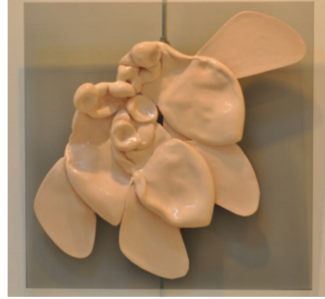
Görsel 27. “Kader” 45x35 cm, 2017

Bazı eserlerde böceğin en rahatsız edici kısmı olduğunu düşünülen bacaklar ön plana çıkarılmaktadır. Bazılarında ise insana özgü ifade ve mimiklerin belirgin bir şekilde ortaya konulduğu görülmektedir. Bu yorumlarla seramik malzemenin plastik dilini vurgulanarak, izleyicinin dikkatini çekmesi için eserlerde canlı renkler kullanılmış olup çiçek, puantiye ve benzeri bezemelere yer verilmiştir.