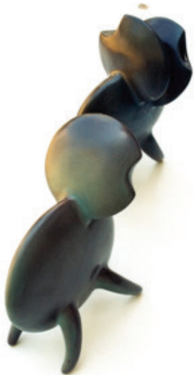
Görsel 14. "İsimsiz" 55x28x30 cm, 2004

Bir diğer Türk Sanatçı Perihan Şan Aslan doğanın önemli bir parçası olduğunu düşündüğü böcekler üzerinde uzun süre çalışmıştır. Böcekler doğadaki tüm hayvan türlerinin önemli bir bölümünü oluşturmaktadır. Bu çeşitlilik çok sayıda farklı biçim, renk ve dokunun var olduğu anlamına gelmektedir. Aslan'ın bu konuya yönelmesinin sebeplerinden biri de söz konusu çeşitliliğidir. Sanatçı, yaptığı çalışmaların bir kısmını böcek biçimlerini soyutlayarak bir kısmını ise doğadan algılayıp zihninde biriktirdiği böcek imgesini yeniden kurgulayarak gerçekleştirmiştir. Aslan için soyutlamalarda yalın, çarpıcı bir biçime ulaşmak önemlidir. Formlarını oluştururken böceklerin temel özelliklerini seçip geometrik birimlere indirgeyerek bu özellikleri ön plana çıkarmaya çalışmıştır (Görsel 14). Böceklerin renklerini vurgulamak için raku gibi farklı redüksiyon pişirim tekniklerini de çalışmalarında kullanmıştır (Görsel 15).