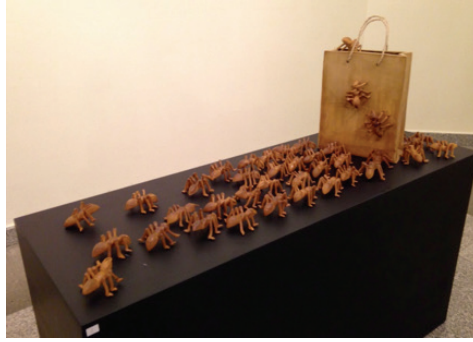
Görsel 24. “Karıncalar” Düzenleme, 50x140x75 cm, 2017