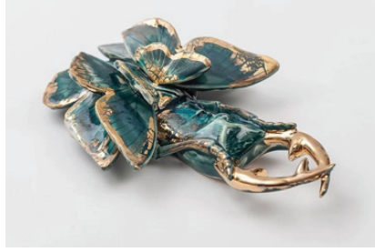
Görsel 30. "Beetle" 14x20 cm, 2016

neklerden bahsederken daha yakından incelendiğinde karanlık duygularınızı kulağınıza nazikçe fısıldamaktadır.