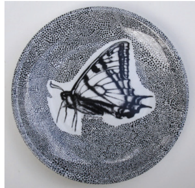
Görsel 23. "İsimsiz" R:28 cm, 2009