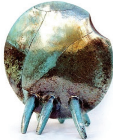
Görsel 15. "Mavi Böcek" 40x35x10 cm, 2004