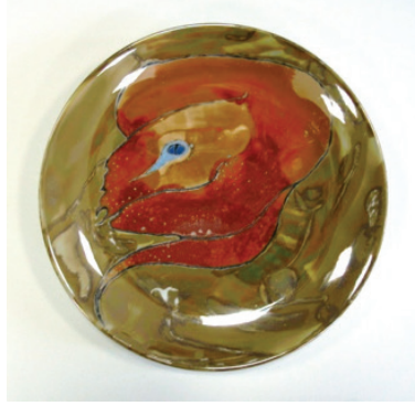
Görsel 19. "Kabuksuz" R:28 cm, 2010

Soner Genç, eserlerinde böcek imgesini kullanan Türk sanatçılardan biridir. Böcek imgesini kullandığı çalışmalarını transfer yöntemi ile gerçekleştiren Genç, farklı böcek türlerini, kara-kalem desen oluşturduktan sonra sır üstü çıkartmalarını kendisi hazırlamaktadır. Siyah-beyaz tonlardaki çalışmalarında doğadan aldığı farklı böcek türleri görülmektedir. Tabakların iç yüzünde belli bir düzende (sıralı, üst-üste) oluşturduğu kompozisyonlarda böcek imgeleri çarpıcı şekilde ön plana çıkmaktadır (Görsel 20-21-22-23).