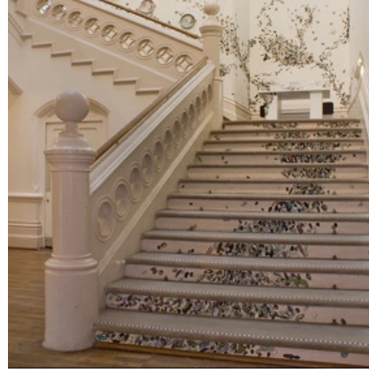
Görsel 33. "Stirring the Swarm" Enstalasyonundan Görünüm, Birimler: 2-20 cm aralığındadır. Nottingham Kalesi, 2012

Amerikalı sanatçı Laura Zindel, eserlerinde böcek imgesine yer veren diğer sanatçılardan biridir. Sanatçının doğaya ve tasarıma gösterdiği ilgi, geçen yüzyılın başında ortaya çıkan Arts & Crafts hareketi tarafından savunulan, materyallerin biçim ve gerçeğin sadeliği ilkesine dayanmaktadır. Sanatçının imge kullanımı ve desenleriyle oluşturduğu yaklaşımının temelinde bu yöntemleri övme ve dekoratif sanat dünyasıyla alakalı olarak koruma amacı bulunmaktadır. Arts & Crafts hareketinin pragmatizmasının aksine Zindel, 17. yüzyılda Avrupa' da başlayan sanat hazineleri ve doğal dünyanın harikaları ile dolu olan Viktorya Dönemi vitrinlerine (Cabinets of Curiosities) ilgi göstermiştir. Saplantılı bir bağlılık ile dolaplara yerleştirilen bu nesnelerin eklektik zenginliği, Zindel' in sanatına verdiği yanıtta açıklanamayan ilkel bir şeye dokunmaktadır. Sanatçının tutkusu, elle ve endüstriyel üretim yöntemleri ile gerçekleştirilen ürünlerin kendine özgü etkisini birleştirmektedir. Ortaya çıkan ürünler doğal yaşamın güzelliklerini, merakını ve çeşitliliğini yansıtmaktadır (Görsel 34-35-36-37) ( http 9 ).