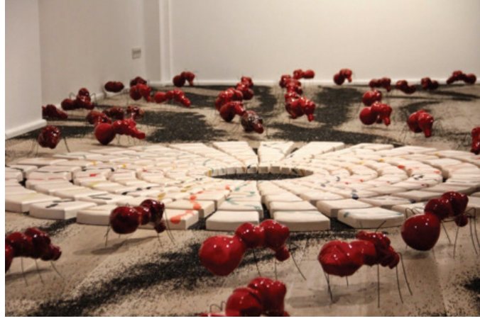
Görsel 6. "Sınana Sınana" İsimli Seramik Sergisinden, 40 m2, 2014