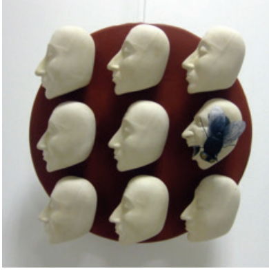
Görsel 12. "Musibet" 50x50x10 cm, 2016