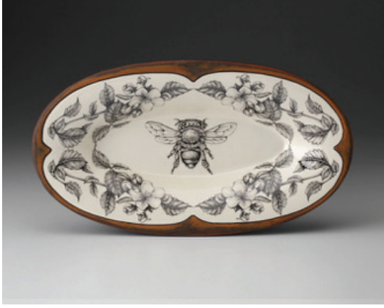
Görsel 36. "Honey Bee" 10" x 21" x 2", 1998