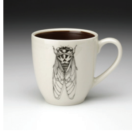
Görsel 37. "Cicade" 4.25", 1998