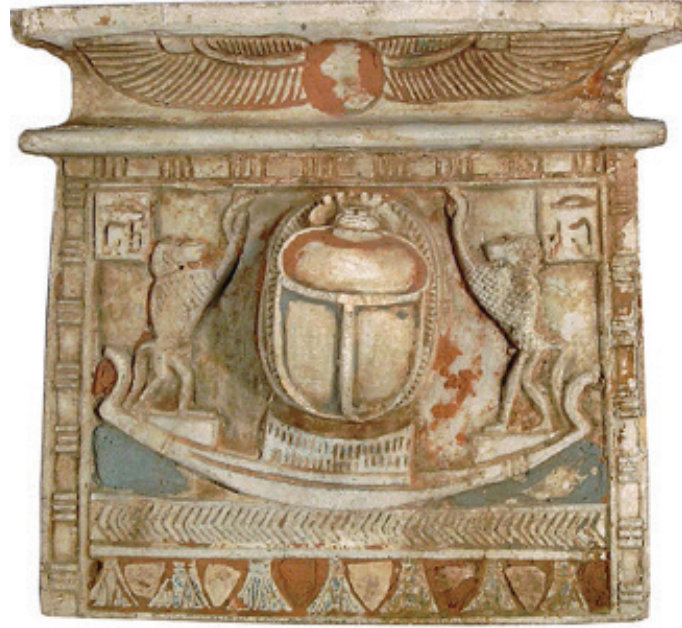
Görsel 2. Üzerinde Scarabaeus yer alan Pektoral, M.Ö. 1292-1070, Mısır Walters Sanat Müzesi'nde sergilenmektedir.

İnsanlık tarihinin en önemli ibadet yapılarından biri olan, Şanlıurfa' ya 15 km. uzaklıkta bulunan ve arkeolojik olarak Çanak Çömlek Öncesi Neolitik A Dönemine (M.Ö 9.600 – 7.300) ait olan Göbeklitepe' de, bir tepe üzerine inşa edilmiş halde boyları 3 ila 6 metre arasında değişen T biçiminde sütunlar bulunmuştur. Arkeologlar bu sütunların yüzeylerinde görülen el ve kol tasvirleri nedeniyle stilize edilmiş insan figürü olduklarını düşünmektedirler. Ayrıca söz konusu taş sütunlar üzerine işlenmiş çeşitli hayvan tasvirleri ve soyut semboller de bulunmaktadır (http 4) . Bu figürler arasında kabartma halinde bir de akrep figürü yer almaktadır (Görsel 3). Bazı arkeologlara göre bu hayvan figürleri tapınağı ziyaret eden farklı kabilelerin sembolü olarak nitelendirilmektedir (http 5) .