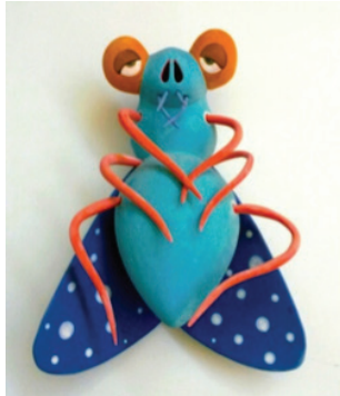
Görsel 28. “Karasinek-I” 15,5x21x14 cm, 2016

Bazı eserlerde böceğin en rahatsız edici kısmı olduğunu düşünülen bacaklar ön plana çıkarılmaktadır. Bazılarında ise insana özgü ifade ve mimiklerin belirgin bir şekilde ortaya konulduğu görülmektedir. Bu yorumlarla seramik malzemenin plastik dilini vurgulanarak, izleyicinin dikkatini çekmesi için eserlerde canlı renkler kullanılmış olup çiçek, puantiye ve benzeri bezemelere yer verilmiştir.