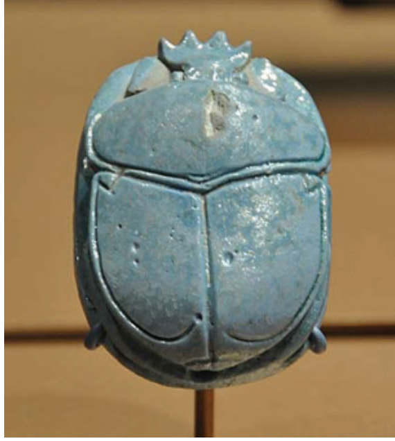
Görsel 1. III. Amenhotep ve Kraliçe Tiye'nin "Evlilik Scarabaeus'u", Sırlı Fayans, 2,8 x 5 x 7 cm. M.Ö. 1390-53, Mısır, Fotoğraf: Stephen Sandoval. New York, Brooklyn Müzesi'nde sergilenmektedir.

Yumurtalarını yuvarlanarak şekillendiren ve gübre topları halinde taşıyan bu canlı, eski Mısır dininde yer alan önemli simgelerden bir tanesidir (http 2) . Eski Mısır Uygarlığında sanatta, dinde, mitolojide, söylencelerde Kutsal Mısır böceğinin önemli bir yeri vardı. Ölümsüzlüğün simgesi, ölümden sonra da yaşamın delili olarak algılanan Scarabaeus, yumurtalarını dışkısının içerisine bırakır ve başı Doğu'ya dönük bir şekilde arka ayaklarıyla söz konusu topağı, toprağın içerisinde iterek yuvasına götürür. Topak incelendiğinde geometrik küreye taş çıkartacak mükemmellikte yuvarlak olduğu görülmektedir. Mısırlılar' a göre, yuvarlanan topak, güneşin gökteki hareketini, topaktan çıkan scarabaeus ise ölümden sonra dirilişi simgeler (http 3) .