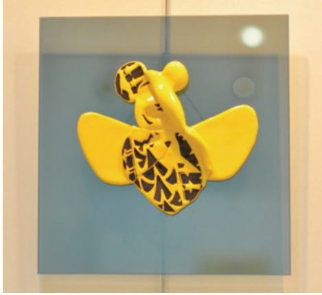
Görsel 26. “Ertuğrul” un Ayakkabısı” 32x35 cm, 2017

rahatsızlık hissine neden olan sinekler, eninde sonunda öldürülmeye mahkûmdurlar. Bu çalışmalarda ölüm ve öldürme olgusunun istemsiz şekilde hoş karşılandığı tek canlı türünün böcekler olduğunu düşünülmektedir. Mizahın pozitif etkili yönü kullanılmış “Öldürmeyen Yoktur” isimli seramik sergisinde buna dikkat çekilmektedir.