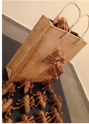
Görsel 25. “Karıncalar” Düzenleme Detay, 50x140x75 cm, 2017

Görsel 26-27-28-29’da görülen Firdevs Müjde Gökbel’ e ait çalışmalar, böcek imgesine yer verilen diğer örneklerdendir. Bilinçaltında özellikle korku, ürkme, kaygı, tiksinti gibi duyguları uyandıran böcekler ele alınmıştır. Bu türden hislerin izleyici açısından bakıldığında daha uyarıcı olduğu düşünülmektedir. Bu düşünceden hareketle böceklerden öncelikle sinek türü seçilmiş, insana özgü duygu hallerinin yanı sıra yaşamında başına gelebilecek durum ve olaylar sinek figürü üzerinden çalışmalarda yansıtılmaktadır. Bu figürler çoğunlukla mizahi bir yaklaşım sergilemektedir.