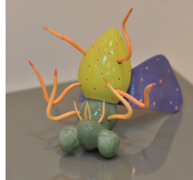
Görsel 29. “Yerler Kaygandı” 22x19x17 cm, 2017

İngiliz sanatçı Anna Collette Hunt, izleyiciyi böcek figürleriyle yarattığı dünyasına çekmek için malzeme olarak kil kullanmaktadır. Yarattığı alan kimi zaman evren kimi zaman ise evrenin küçük bir parçası olabilmektedir. İzleyiciler sanatçının eserlerindeki gizli detayları katmanlı yüzeylerde aramakla yükümlüdür. Gerçekleştirdiği kabartmalı illüstrasyonlara dokunma ya da meraklı bir şekilde cezbedici makaslıböceği (geyik böceği) tutma isteğini inkâr etmek zordur (Görsel 30). Yüzeylerde yakalanan sahneler ve kompozisyonlar, tarihi ihtişam ve geçmiş gele-