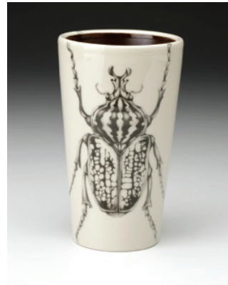
Görsel 35. "Goliath Beetle" 6", 2010