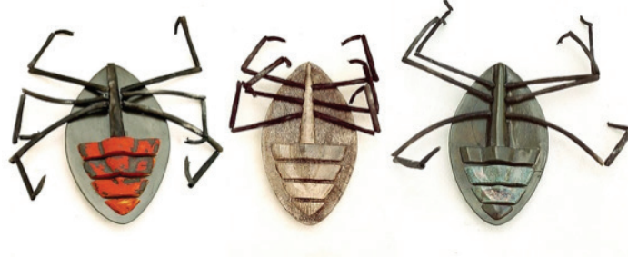
Görsel 17. "İsimsiz" 250x100x15 cm, 2004

Pınar Genç, eserlerinde böcek imgesini kullanan Türk sanatçılar arasındadır. Bazı böceklerin sahip olduğu çarpıcı renkler ve anatomik özellikleri sanatçının dikkatini çekmiştir. Tabak formu üzerinde çalıştığı böceklerin canlı renklerini lüster tekniği ile ortaya koyan Pınar Genç' in gerçekçi çalışmalarının yanı sıra fantastik bir yaklaşımla ortaya koyduğu eserleri de mevcuttur (Görsel 18-19).