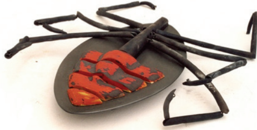
Görsel 16. "İsimsiz" 50x100x15 cm, 2004

Böcek imgesini yeniden kurgularken böceklerin hareketleri ve böcek kavramının insan üzerinde oluşturduğu psikolojik çağrışımları da göz önünde bulunduran sanatçı, böceklerin insanlar tarafından en çok tahrip edilen canlı türlerinden biri olduğunu ve böcek denildiğinde ilk akla gelen kavramlardan birinin de öldürmek olduğunu söylemektedir. Özellikle ters dönmüş böcek formlarını üretirken ölüm- öldürmek kavramları ve Kafka'nın "Dönüşüm" adlı romanında kendini dev bir böceğe dönüşmüş olarak bulan kahramanı Gregor Samsa dan ilham almıştır (Görsel 16-17) (Perihan Şan Aslan ile Eserleri Üzerine Röportaj) (Röportaj Tarihi: 05.07.2017).