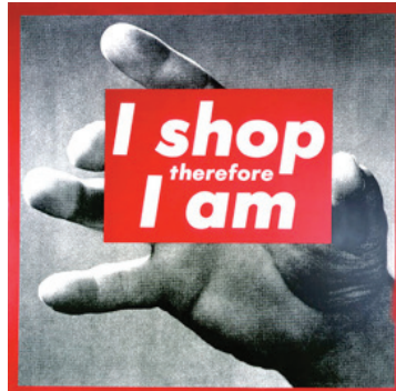
Görsel 2. Barbara Kruger, "Untitled (I shop therefore I am/ Alışveriş yapıyorum, öyleyse varım!)", 125x125 cm., Screenprint on vinyl, 1987, The Museum of Modern Art, Manhattan

Hegel'in bağımlı özbilinç ve bağımsız özbilinç olarak ifade ettiği iki karşıt kutup, efendi ile köle ilişkisi, Kruger'in çalışmasında gerçekliğin temsili olarak farkında olma durumu haline dönüşmüş ve kölelik konumunda, ona yüklenen her türlü toplumsal statünün farkında olan fakat toplumsal gerçeklik kapsamında bunu meşrulaştıran kadın imgesine gerçekliğin duyurulması halini almıştır. Erkek bağımsız bir özbilinç konumunda yer alabilir, ancak kadın kendisi hakkında farkındalık geliştirerek ve "özel bir insan olduğunun" farkına vararak kendisini özbilinç konumuna taşıyabilir ve bağımsız bir varlık olarak yaşayabilir. Kruger'in çalışmasında yer alan manifesto budur.