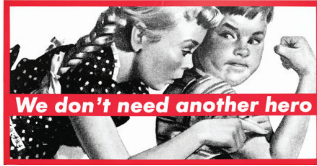
Görsel 3. Barbara Kruger, "Untitled (We don't need another hero)", 276.54 x 531.34 x 6.35 cm, Silkscreen on vinyl, 1987, Whitney Museum of American Art, New York.

" We Don't Need Another Hero (Başka Bir Kahramana İhtiyacımız Yok) " isimli çalışması da (Görsel 3), sanatta feminist hareketin önemli göstergelerini sunmaktadır. Kadının güçlü olduğunu, bağımsız bir bilinç olarak da yaşamsal varoluşta yer alabileceğini, 'öteki'ne, bir başkasına ihtiyacı olmadığını vurgulamaktadır. Bu çalışmada Kruger'in feminist hareketin başlarında kadın erkek eşitliğini savunan manifestonun aksine, kadının erkeğe ihtiyaç duymaması sloganı üzerinde, kadını yüceltme yoluna gitmiş ve dengeyi kadınsal çizgiye çekerek, kadının üstünlüğüne gönderme yapmıştır. 'Biz' olarak ifade ettiği topluluk tüm insanlığın ötekileştirilmiş kadınlarıdır ve her türlü dil, din, ırk ayrımı yapılmadan kendi farkındalıklarını geliştirmeleri üzerine eleştirel bir söylem diliyle mesaj görsellik ve tipografik etki ile vurgulanmıştır.