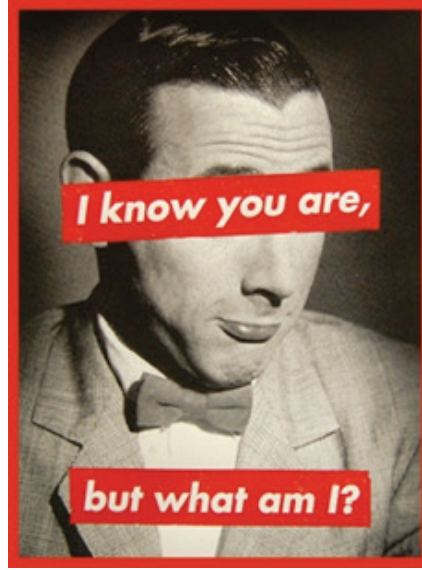
Görsel 4. Barbara Kruger, "Untitled (I know you are, but what am I? / Kim Olduğunu Biliyorum, Ama Ben Kimim?)", 45.72 x 60.96, Silkscreen on vinyl, 1988

Owens'a göre Kruger; "Your/My ya da diğer çalışmalarında kullandığı I/You gibi dile ait temsilleri" özneyi değiştirmek için kullanmıştır" (Owens, 2001, s. 236-237'den aktaran Kozlu, 2009, s. 12). Yani ben ve öteki, kadınlar ve erkekler, efendi ile köle ilişkisine gönderme yaparak, böyle bir ilişkinin ve diğeri üzerinde üstünlük kurmaya çalışan insan figürünün ya da toplumsal yapılar ve sistem dayatmalarının yalnızca bir kurgudan ibaret olduğunu, bireyin özgür olduğunu ve özgür olduğunu bildiği halde ona dayatılan toplumsal rolleri yaşamak zorunda olmasına nedenler bulmak yerine, özne konumuna gelebilmek için kendi varoluşsal gerçekliğinin farkına varmasının gerekliliğini temsil etmektedir. Özüdoğru sanatta feminist hareketi tanımlarken feminist sanatın; "sınırlarını erkeklerin koyduğu ve kaidelerini erkeklerin belirlediği bir sanat dünyasında kadın temsillerinin yarattığı stereotipleri" sorguladığını belirtmiştir (Özüdoğru, 2010, s. 114). Barbara Kruger'in de kadına dair ortaya koyduğu çalışmalar bu kadın algısını rahatsız edici bir gerçekliğe taşıyarak temsil etmektedir. Gouma-Peterson ve Mathews'in ifade ettiği gibi; (2008, s. 37). "Temsil, önceden belirlenmiş toplumsal cinsiyet kavramlarını yeniden sunarak farklılığı inşa eder; bu kavramlar, tüm kurumlarımızı şekillendirir ve ideolojimizin ve inanç sistemimizin temelinde yer alır. Aynı durum erkek ve kadın kimliği hakkındaki kültürel tanımlarımız için de geçerlidir".