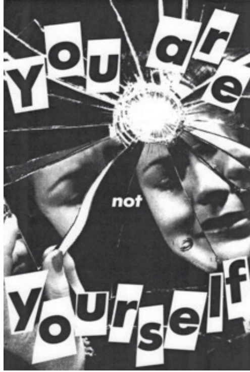
Görsel 7. Barbara Kruger, "Untitled (You're not yourself/Sen kendin değilsin)", 27.3 x 18.1 cm, Photograph and type on paper, 1981, Mary Boone Gallery, New York

You Are Not Yourself (Sen Kendin Değilsin) ifadelerinin yer aldığı çalışma (Görsel 7), gene sanatta feminist hareket kapsamında değerlendirilebilecek bir yaratımdır. Afiş niteliği taşıyan çalışmada iletilmek istenen mesaj izleyiciye doğrudan sözcükler aracılığıyla gönderilmekte ve kadın figürü üzerinden toplumun tüm kadın bilincine duyurulmaktadır. "Sen Kendin Değilsin" söylemiyle aktarılmak istenen, kadın imajının ona karşıt cins ve toplumsal düzen tarafından yüklenen bir anlayış olduğu, özgür ve eşitlikçi bir toplum için Hegel diyalektiğinin karşıtların savaşı ve özbilinç durumuna gelme halinin kadın tarafından bilinçli olarak sezilmesi ve yaşanması gereken bir eylem olduğudur. "... her nasılsa baştan beri var olan, sabit, dolayısıyla en azından tarihin belli bir noktasında bağlamıyla ilgi kurulmaksızın gün yüzüne çıkarılabilecek bir kadınlığın izinin sürülmesi"nin gerekliliği Kruger'in incelenen çalışmasında da göstergeler arasından temsil edilen gerçekliktir (Peterson ve Mathews, 2008, s. 69). Bu gerçeklik çalışmanın dilsel göstergeleri ile aktarıldığı kadar görselin parçalanmışlığı, yapısöküm yaklaşımı bakımından da dile getirilmektedir.