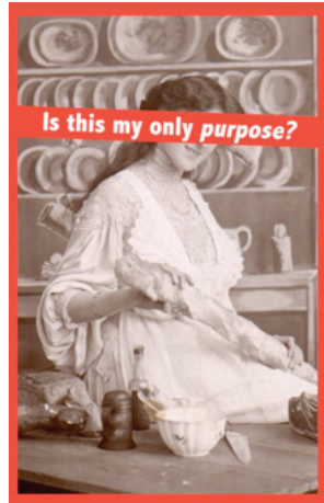
Görsel 5. Barbara Kruger, “Untitled (Is this my only purpose?/Bu yapmam gereken tek şey mi?)” , 1992

Kruger gene toplumsal sistem içinde kadına atfedilen rolleri eleştirel ve kendine özgü söylem diliyle aktardığı “Is This My Only Purpose (Bu Yapmam Gereken Tek Şey Mi?)” isimli çalışmasında (Görsel 5), kadın figürünü yemek yapma eylemi içerisinde betimlemiştir. Tarih boyunca erkeğin bağımsız olarak gerçekleştirdiği eylemler ve çalışma görevlerinin karşısına yerleştirilen kadının erkeğe bağımlı ve ev içerisindeki görevleri feminist sanat hareketi içerisinde farklı sanatçılar tarafından seçilen ve eleştirel bir yaklaşımla vurgu yapılan temel konulardan biri olmuştur.