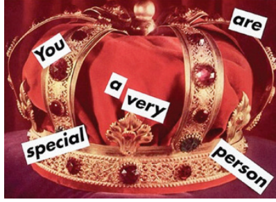
Görsel 1. Barbara Kruger, "Untitled (You are a very special person)", 235.59 x 320.04 cm, Photographic silkscreen on vinyl, 1995, The Broad, Los Angeles

Kruger'in "You Are a Very Special Person" isimli çalışmasında (Görsel 1); bir kral tacı temsil edilmiştir ve bu temsille özel olmak durumu arasında ilişki kurulmuştur. Selmanpakoğlu'na göre; (2015, s. 516). "... Kral olmanın ya da herhangi bir taç sahibi olmanın bizi özel yapması, dahası birşey yapması arasındaki ilişkidir buradaki Temsil edilen gerçeklik kadın bilincine gönderme yaparken, kral tacı ile erkek imgesi vurgulanmış ve paradoksal bir yaklaşım elde edilmiştir. Kruger'in çalışması, erkek egemen bir toplumda metalaştırılan, ötekileştirilen, özbilincinin farkında olması 'kral' ya da diğerleri tarafından engellenen kadın bilincine yapılan bir müdahaledir.